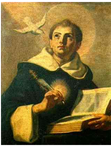
Thomas von Aquin

„Im Anfang der Zeit ist alles von Gott geschaffen worden; 'im Anfang' heißt auch: 'Im Sohn'; 'im Anfang' heißt auch: 'Vor allem!'.“ (Summa Theologica, Teil I, Q. 47, Art. 3)